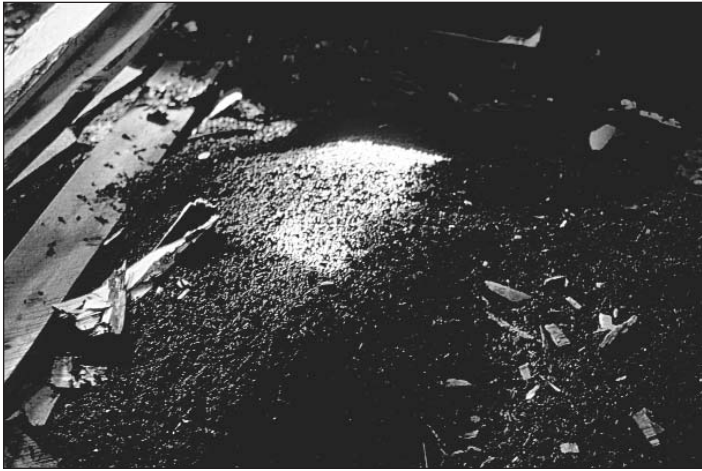
Lort av flaggermus på et loft indikerer at de har hatt tilhold her i lang tid. Bat droppings on the floor of an attic indicating long occupancy.

bestanden i området? Ettersom stadig flere hus blir pussa opp og utbedra, kan mangel på egne steder bli et problem. Dette er nok den største trusselen mot flaggermus i Nord-Norge i dag (jf. ISAKSEN m.fl. 1998, GJERDE 1999). Andre trusler som habitatødeleggelse og miljøgifter antas å ha liten betydning, bortsett fra kanskje den omleggingen (nedleggingen) av landbruket som foregår. Færre husdyr kan føre til færre insekter, og dermed mindre mat for flaggermusene. Imidlertid jakter flaggermusene mest i tilknytning til skog (jf. JONG 1994), så dette er nok et lite problem sammenlignet med boligproblemet.