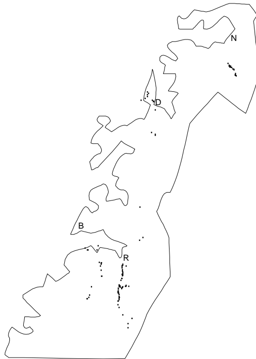
Figur 2. Kart over nordre del av Nordland med steder hvor nordflaggermus ble funnet plotta inn. Merk at selve kartet er grovt og ikke stemmer helt med terrenget. Dette er registreringer langs veier, så den egentlige utbredelsen vil strekke seg utover til hver side av veien. Hver prikk kan representere én til mange registreringer. R=Rognan, B=Bodø, D=Drag, N=Narvik. Sketch map of the northern part of Nordland county with recordings of the northern bat made along roads.

Undersøkelsen foregikk somrene 1999, 2000 og 2001. Vinteren 1999 gikk jeg ut i en del massemedia (lokalaviser og lokalradio) og ba om informasjon om flaggermus. Dette førte til mange henvendelser fra Nordland, men få fra Troms. Innen studieområdet ble alle hus der det ble oppgitt å være flaggermus kontrollert. Utbredelsen ble videre undersøkt ved å kjøre langs veier med ultralyddetektor (Pettersson D120 og D200) i bilvinduet og plote alle registreringer på kart med GPS (til nærmeste 100 m). Alle områder hvor det var sannsynlig å finne flaggermus ble undersøkt, men det betyr ikke at absolutt alle kriker og kroker ble besøkt. Særlig langs kysten er det flere områder som ikke er undersøkt, og Vesterålen og Lofoten ble ikke undersøkt i det hele tatt. Utbredelsen kan derfor være noe større enn det som hittil er funnet. Arbeidet foregikk i perioden juli-september, men hovedsakelig i august.