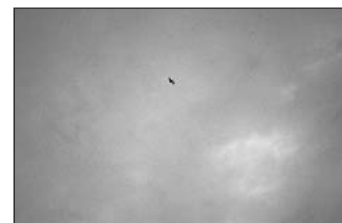
Nordflaggermus på jakt i midnattssol (Saltedal i juli). A hunting northern bat at midnight (Saltedal in July).

Det ser ut til at flaggermusene ankommer ynglekolonien i første halvdel av juli (evt. også i slutten av juni), men det kan være stor variasjon mellom de enkelte stedene. Ungene begynner antakelig å fly fra midten av august og kolonien blir forlatt mot slutten av august (jf. RYDELL 1992), selv om enkelte flaggermus kan bli værende utover i september.