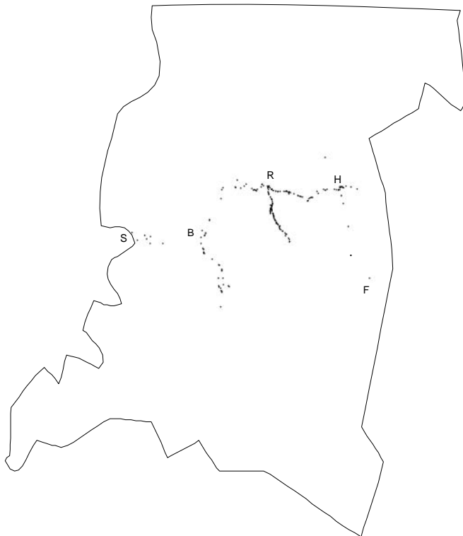
Figur 3. Kart over den sørlige delen av Troms med steder hvor nordflaggermus ble funnet plotta inn. Kartet er grovt og registreringene ble foretatt langs veier som i Figur 1. S=Sjøvegan, B=Bardu, R=Rundhaug, H=Holt, F=Frihetsli. Map of the southern part of Troms county with recordings of the northern bat.

utveksling østover med Sverige, særlig fra det sørligste området. Det er mulig at Salten-bestanden også finnes videre sørvestover langs kysten og kanskje har forbindelse med bestanden i Rana-området. Dette er ikke undersøkt, men jeg fikk flere meldinger om ubestemte flaggermus i Glomfjord-området. En registrering av flaggermus i Junkerdalen (2001) er også tatt med i Figur 2, selv om denne ikke ble artsbestemt (Marianne Iversen pers. medd.). Ved Rana Museum finnes også ei nordflaggermus som ble funnet i Junkerdalen i 1992 (arkivkopi fra Sissel V. Dahlberg).